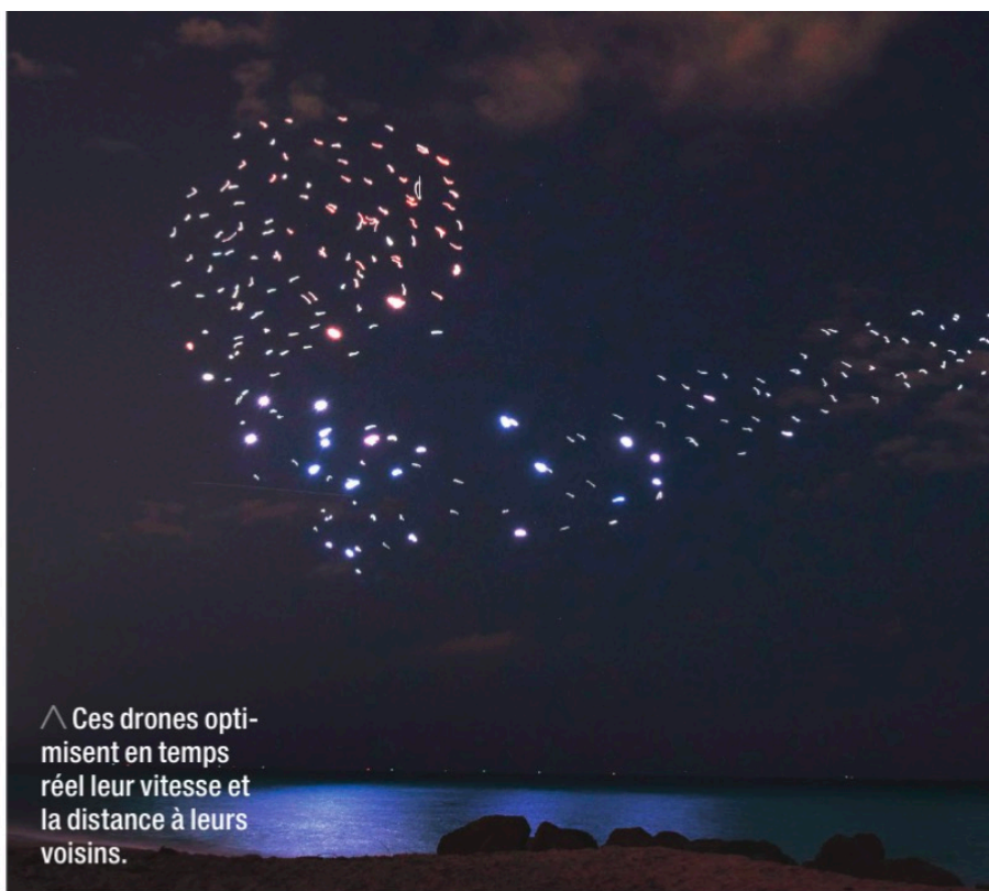
^ Ces drones optimisent en temps réel leur vitesse et la distance à leurs voisins.

La première de ces approches est inscrite dans l'ADN même de la robotique en essaim : elle transpose littéralement l'idée originelle pour s'inspirer de la nature et tenter de coder le comportement des insectes pour l'injecter dans des