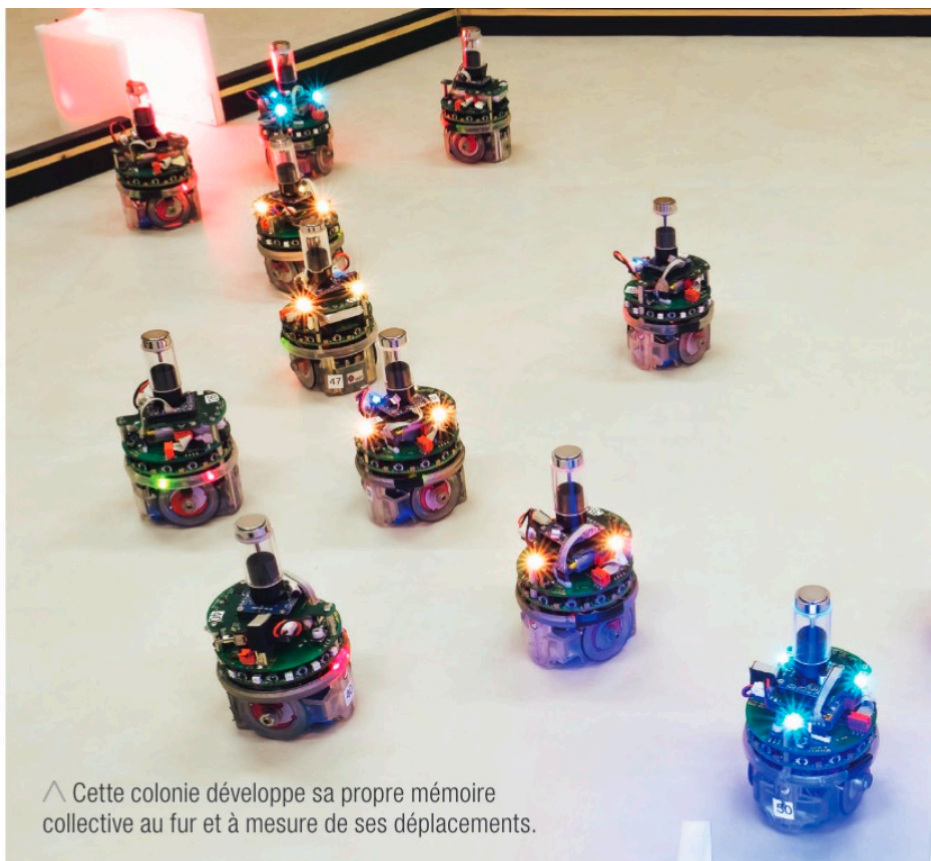
△ Cette colonie développe sa propre mémoire collective au fur et à mesure de ses déplacements.